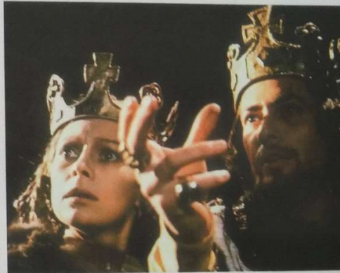
Kadr z filmu Tragedia Makbeta w reż. Romana Polańskiego, 1971