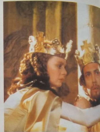
Kadr z filmu Tragedia Makbeta w reż. Romana Polańskiego, 1971

Makbet Skąd ten odgłos? Cóż się to ze mną stało, kiedy lada Szmer, lada szelest przejmuje mię dreszczem? Co to za ręce? Ha! wzrok mi pożera Ich widok. Mógłżeby cały ocean